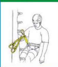
Posición de descanso en tramos desplazados