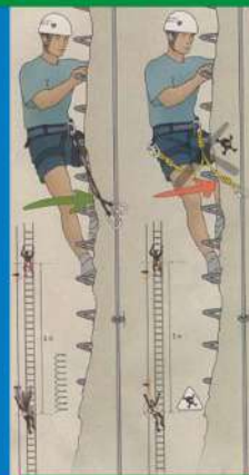
Utiliza casco y disipador

Sin disipador el factor de caída es mortal