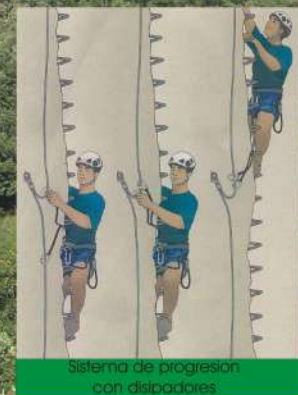
Sistema de progresión con disipadores

Esta vía ferrata se incluye dentro del proyecto "Adecuación de infraestructuras y aplicación de nuevas tecnologías para el aprovechamiento sostenible de recursos naturales y culturales", promovido por el Ayuntamiento de Ruesga y financiado por la Consejería de Ganadería, Pesca y Desarrollo Rural del Gobierno de Cantabria. Otra de las actuaciones del mismo ha sido la elaboración de la aplicación turística para Smartphones "Ruesga en tu mano", que puedes descargar escaneando este código: