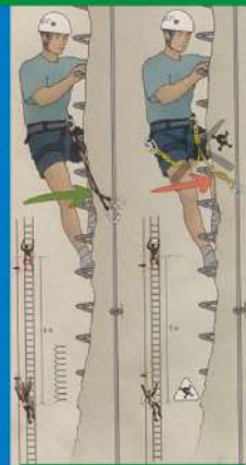
Utiliza casco y disipador