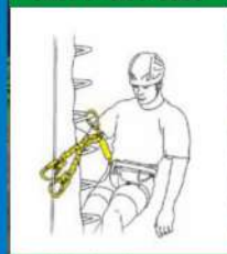
Posición de descanso en tramos desplazados